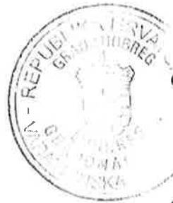
Gradonačelnik Grada Ludbrega Dubravko Bilić